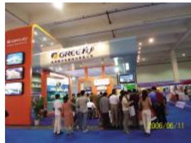
▲格力电器在中国节博会上备受青睐

本报讯 日前，由国家发改委等七部委联合组织的“全国节能宣传周上海系列活动暨第三届中国节博会”在上海国际博览中心拉开帷幕。为响应党和政府建设节约型资源社会和环境友好社会的号召，格力电器以强大的空调产品阵容参加了此次展会，